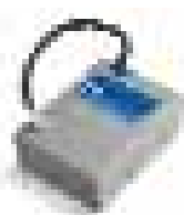
PS124 batteria 24V con caricabatterie integrato