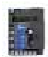
SOA2 centrale di ricambio per SO2000